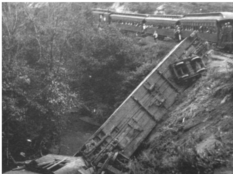
Tren descarrilado por zapatistas en 1913.

radicales que lucharon durante la Revolución (el zapatismo y el villismo) habían sido derrotadas en el terreno militar por la más moderada y liberal (el constitucionalismo carrancista, a su vez escindido en una fracción más conservadora, la encabezada por el ex gobernador porfirista de Coahuila, Venustiano Carranza, por una parte; y el ranchero sonoreño que había demostrado una capacidad de liderazgo militar y olfato político extraordinarios, Álvaro Obregón, por la otra), y c) la acción organizada de los trabajadores y sindicatos emergentes a finales de 1916 había sido golpeada duramente por la hiperinflación de dicho año (la capacidad de compra de los salarios había llegado a un piso inimaginable dos años atrás) y la reducción de la planta productiva se había hecho sentir en numerosos centros de trabajo. ¿Por qué entonces los constitucionalistas, dueños de la Asamblea Constituyente, cedieron y aprobaron el detallado artículo 123 con un perfil claramente prolaboral?, ¿por qué no apegarse a la respuesta en ese terreno de la anterior Constitución, la de 1857, que consideraba a la asociación sindical una violación a la libertad de comercio y era además la visión del “Primer Jefe” y el contenido del artículo 5 de su proyecto? Sencillamente porque ello hubiese significado voltear la cara a las transformaciones políticas en el seno de la realidad industrial.