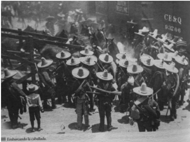
Se embarca la caballada. Los rebeldes llevan todos sombrero y fusil.

obrera, que se jugaban el trabajo e incluso la vida al encabezar movilizaciones contra el despotismo industrial del porfiriato, no tenía comparación con las características de los nuevos líderes de los sindicatos legalizados, que fungían como administradores de los nuevos contratos colectivos (aunque a veces pudieran ser las mismas personas), con estabilidad y poder crecientes en el panorama político local e incluso nacional, sujetos al anzuelo siempre dispuesto de capitalistas y políticos ambiciosos. Para Ramón Eduardo Ruiz, uno de los críticos más pesimistas del resultado de las movilizaciones obreras de la revolución, las exigencias a las que parecía haberse dado respuesta en el artículo 123, se habrían transformado en la práctica en un conjunto de promesas nebulosas, ambiguas, y a menudo “huecas” (Ruiz, 1987:136): en este contexto, en apariencia desalentador, cabe la pregunta: ¿fue entonces el artículo 123 —o incluso la revolución entera—, puro atole con el dedo ? Ensayemos una respuesta a partir de la experiencia de los trabajadores ferrocarrileros.